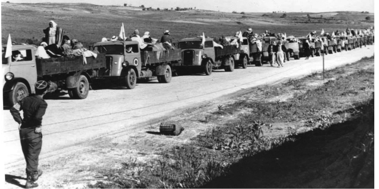
Εκατοντάδες χιλιάδες Παλαιστίνιοι εκτοπίστηκαν από τις εστίες τους κατά τον Πρώτο Αραβοϊσραηλινό πόλεμο. Για την καταστροφή της παλαιστινιακής κοινωνίας και πατρίδας το 1948, επικράτησε ο όρος Νάκμπα

Οι δημόσιες διαβεβαιώσεις του κόμματος του Begin δεν αποτελούν οδηγό για τον πραγματικό του χαρακτήρα. Σήμερα μιλούν για ελευθερία, δημοκρατία και αντιιμπεριαλισμό, ενώ μέχρι πρόσφατα κήρυτταν ανοιχτά το δόγμα του φασιστικού κράτους. Είναι στις δράσεις του που το τρομοκρατικό κόμμα προδίδει τον πραγματικό του χαρακτήρα. Από τις παλιότερες δράσεις του μπορούμε να κρίνουμε τι αναμένεται να